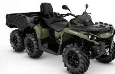
MAX 6x6 PRO