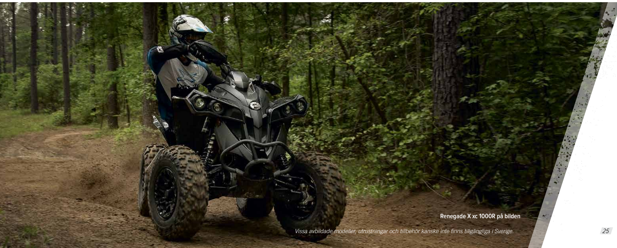
Renegade X xc 1000R på bilden

Vissa avbildade modeller, utrustningar och tillbehör kanske inte finns tillgängliga i Sverige.