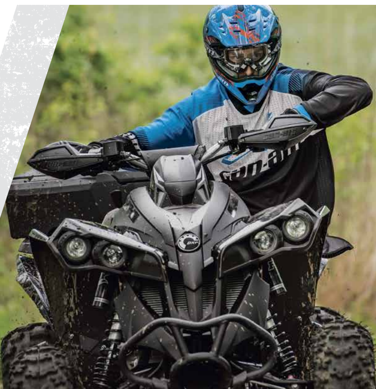
Renegade X xc 1000 på bilden

Motor- och färgalternativ varierar beroende på paket. Fullständiga specifikationer finns på can-amoffroad.com