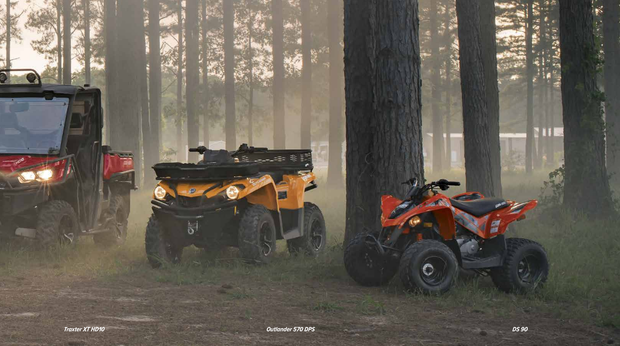
Traxter XT HD10