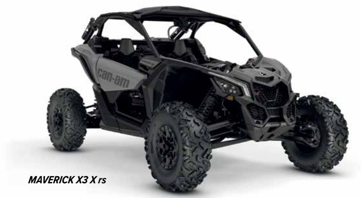
MAVERICK X3 X rs