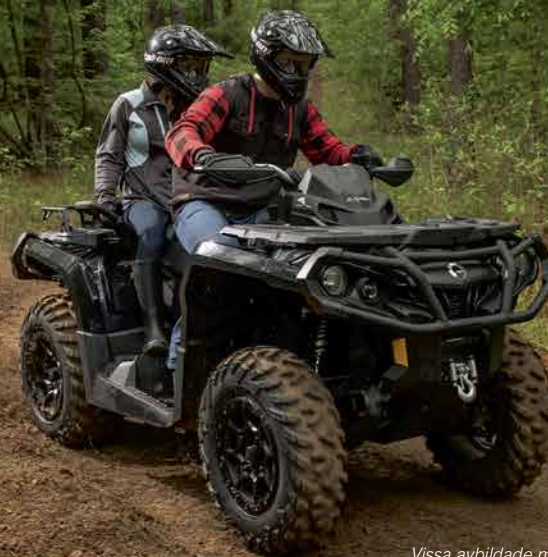
Outlander MAX XT 1000 på bilden

Vad du än utsätter den för är Outlander 6x6 mer än redo. 6x6-drift med de kraftfullaste motorerna i sin klass innebär att nästan ingenting är för tungt, för moddigt eller för brant. Och det stadiga, ombyggbara lastflaket Dual-Level™ är unikt i branschen.