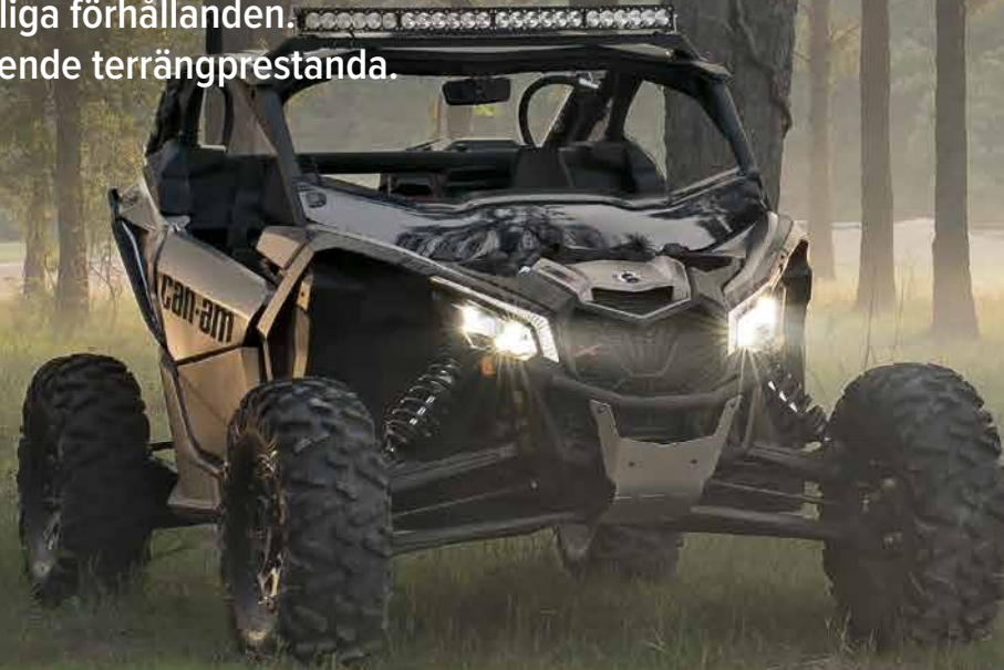
Maverick X3 X rs TURBO R