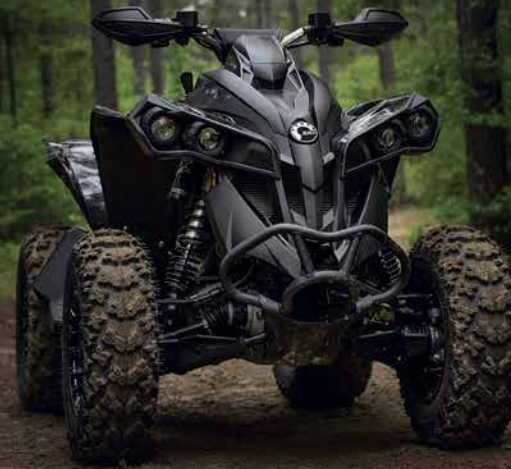
Renegade X xc 1000R på bilden