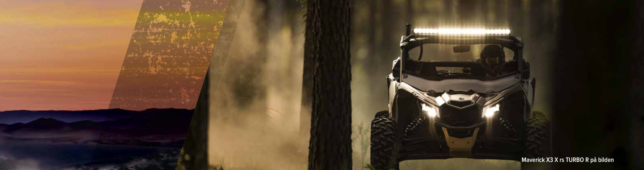
Maverick X3 X rs TURBO R på bilden