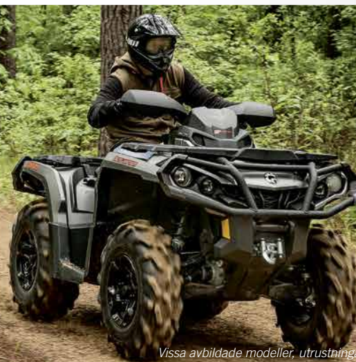
Outlander XT 1000 på bilden

Vissa avbildade modeller, utrustningar och tillbehör kanske inte finns tillgängliga i Sverige.