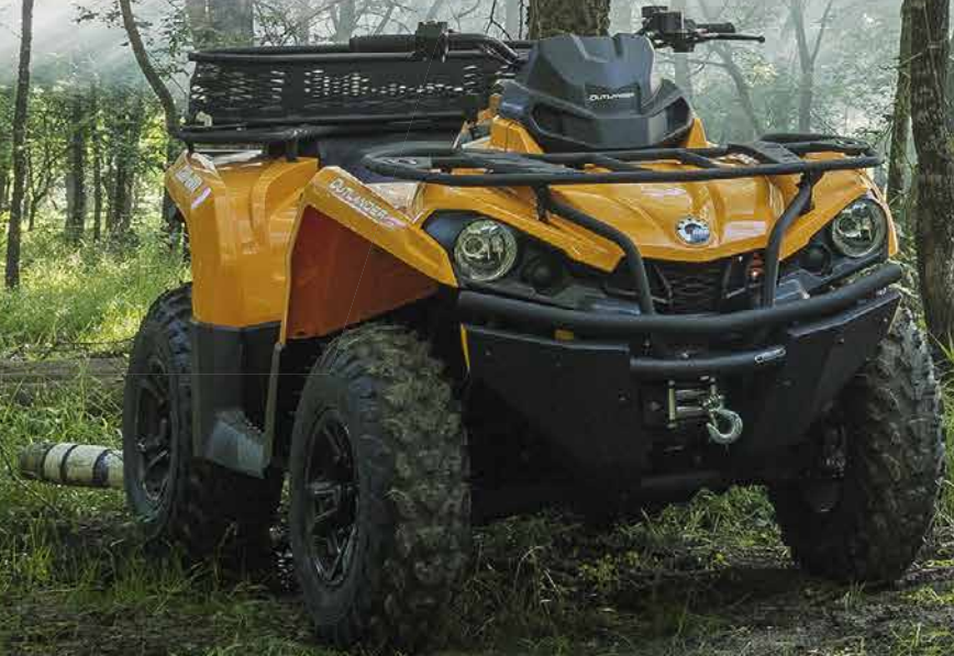
Outlander 570 DPS

Varje Can-Am-terrängfordon är en perfekt kombination av branschens bästa prestanda, precisionsmanövrering och ergonomisk design.