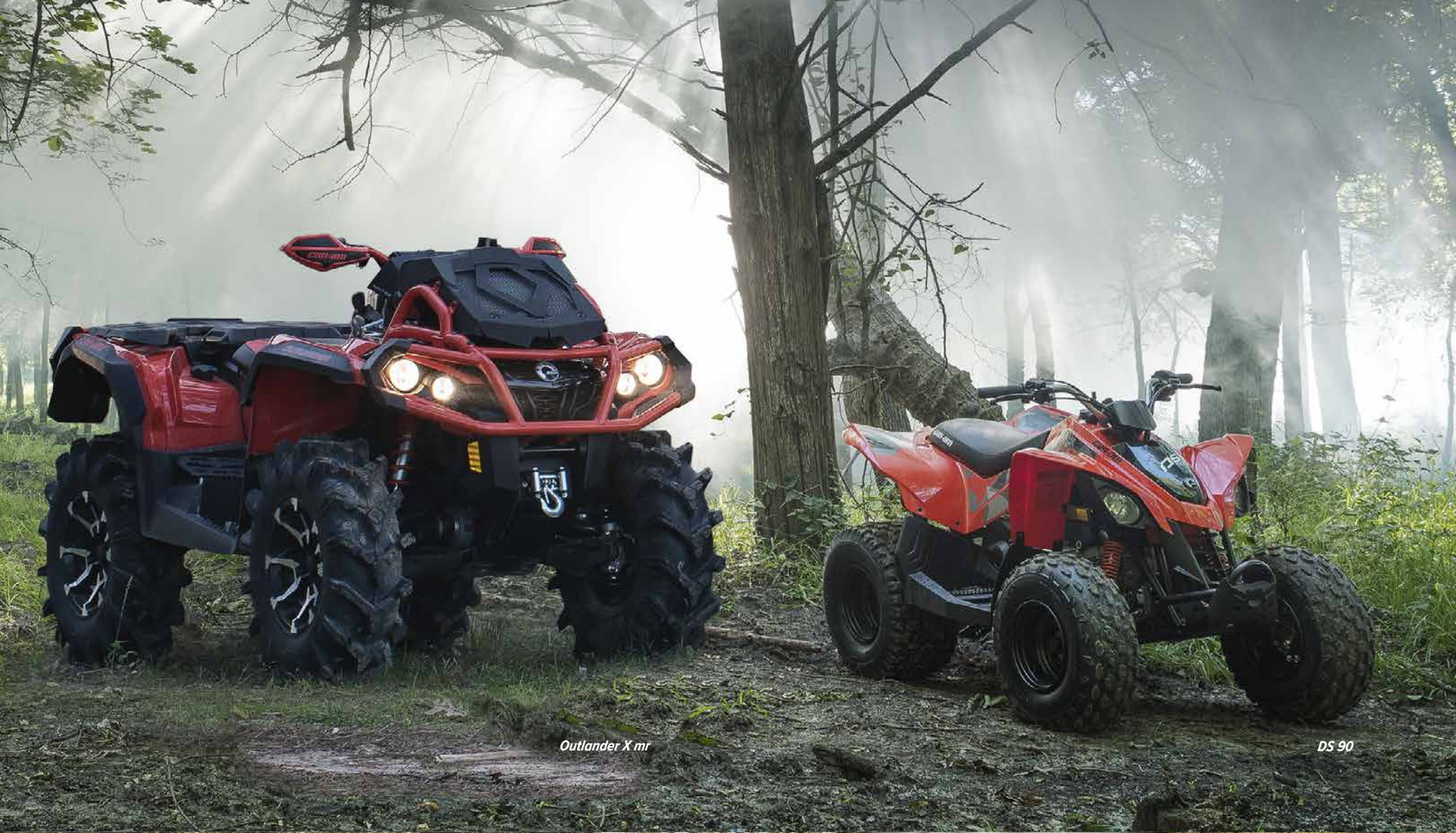
Outlander X mr