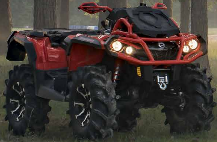
Outlander 1000R X mr

Can-Am® skapar världens mest innovativa terrängfordonsfamilj. Vi har ägnat flera decennier åt att fullända dem med hjälp av ambitiös konstruktion, utveckling och testning under verkliga förhållanden. Detta är resultatet av en lång tradition av enastående terrängprestanda.